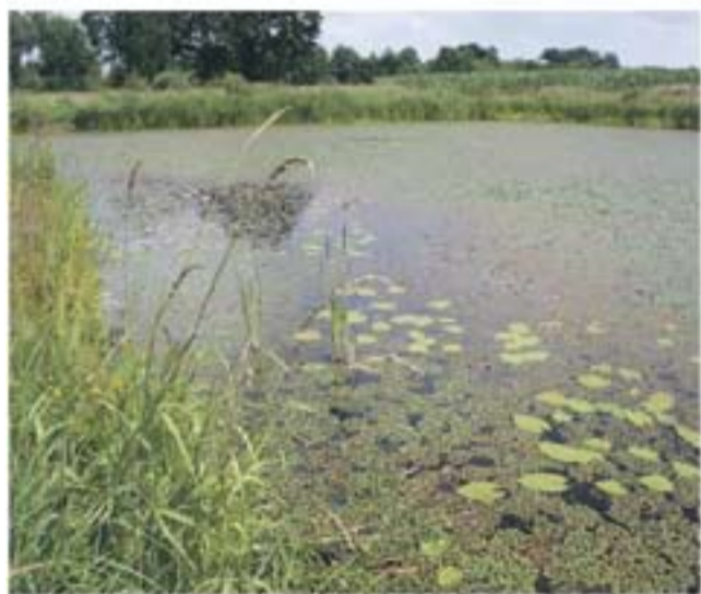
Rezerwat Staw Nowokuznicki objęty projektem będzie jeszcze piękniejszy

Kędzierzyn-Koźle i Uniwersytet Opolski postawiły na ochronę zabytkowych parków. Samorząd Kędzierzyna-Koźla poddaje renowacji park w Sławęcicach. Projekt, którego całkowity koszt to ponad 1,5 mln zł,