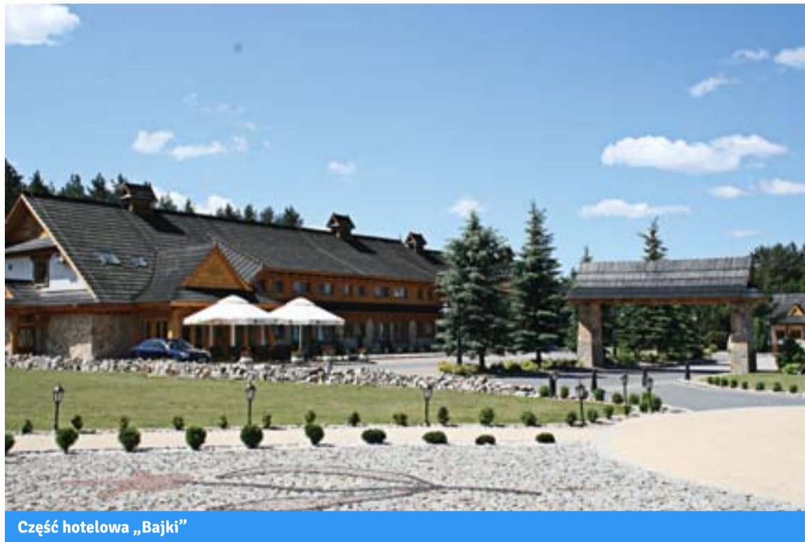
Część hotelowa „Bajki”

Kompleks został wybudowany według projektu Piotra Władyszy z nyskiej Pracowni Architektonicznej Atrium, urządzenia wewnątrz podjęła się architekt Ewa Budniewska-Bratek. Powstał ciekawy, choć surowy, projekt spójny z drewnianymi bryłami obu budynków. Recepcję zdobią proste kanapy i fotele, zwraca uwagę mozaika na podłodze. 38 pokoi (łącznie 85 miejsc) urządzonych zostało funkcjonalnie i ze