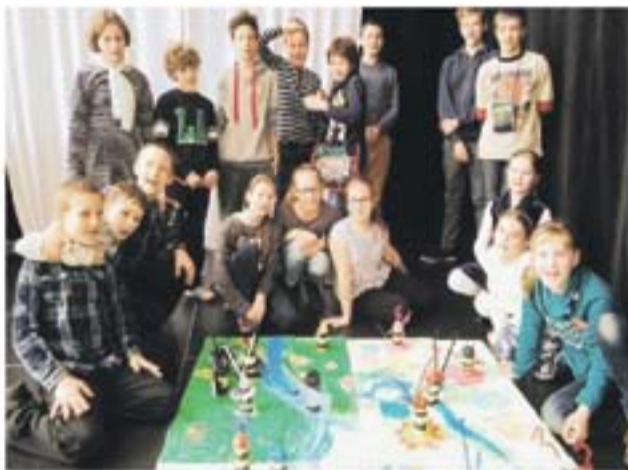
Warsztaty ekologiczne dla dzieci prowadzone w ramach projektu w Filharmonii Opolskiej

zakłada m.in. stworzenie warunków do ochrony i rozwoju zagrożonego chrząszcza – pachnicy dębowej, zaplanowano również usunięcie niechcianych gatunków, połączone z nasadzeniami rodzimych krzewów i bylin, a także ochronę istniejących oraz wyznaczenie nowych po-