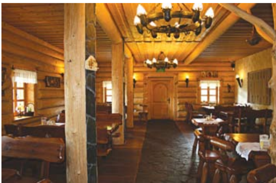
Sala restauracyjna na parterze