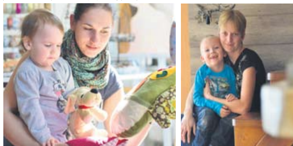
Projekty wspierające rodzinę były realizowane już w latach 2007-2013. Na zdjęciu: uczestniczki projektów współfinansowanych ze środków Europejskiego Funduszu Społecznego

Pierwszy nabór wniosków w ramach działania 8.1 Dostęp do wysokiej jakości usług zdrowotnych i społecznych – Wsparcie rodziny i pieczy zastępczej RPO WO 2014-2020 już się zakończył. Kolejny nabór planowany jest na III kwartał 2017 r.