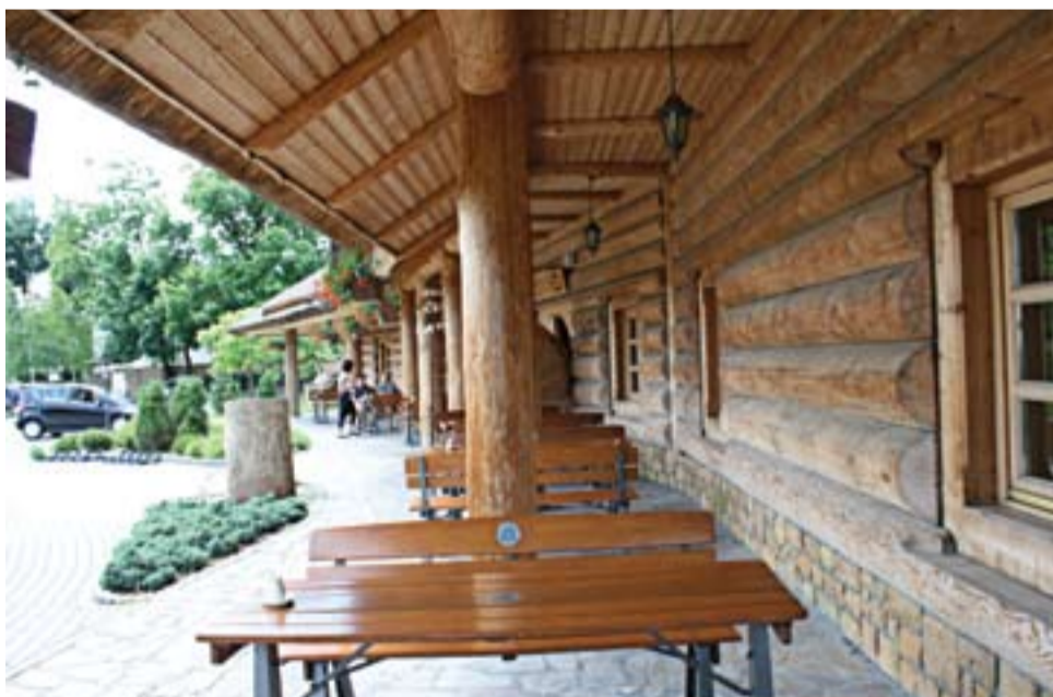
Kontemplować przyrodę można z podcieni karczmy.

Projekt budowy karczmy regionalnej „Karczma ze smreka” został zrealizowany z Regionalnego Programu Operacyjnego Województwa Opolskiego na lata 2007 – 2013. Działanie 1.4 Rozwój infrastruktury turystycznej i rekreacyjno-sportowej, poddziałanie 1.4.1 Wsparcie usług turystycznych i rekreacyjno-sportowych świadczonych przez przedsiębiorców. Projekt realizowany był od 1.10.2008 - 31.12.2010. Jego wartość, to prawie 1,5 mln złotych, z czego dofinansowanie unijne wyniosło 797 tysięcy złotych.