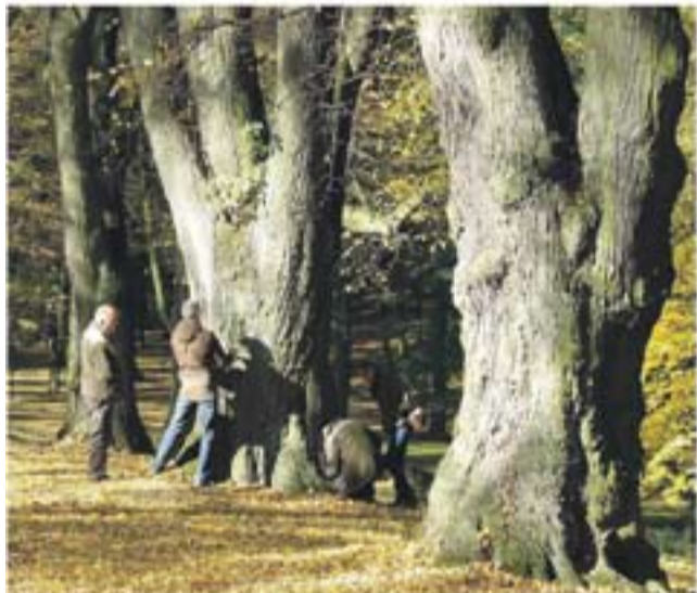
Zespół Opolskich Parków Krajobrazowych bada, czy w przydrożnych drzewach występują chronione gatunki zwierząt

W opolskim ogrodzie zoologicznym samorząd Opola realizuje projekt za kwotę 6,38 mln zł. To m.in. przebudowa i rozbudowa istniejącej szklarni, by dostosować ją do potrzeb ochrony i odtworzenia 13 zagrożonych gatunków zwierząt i roślin europejskich. Stara szklarnia zostanie zmo-