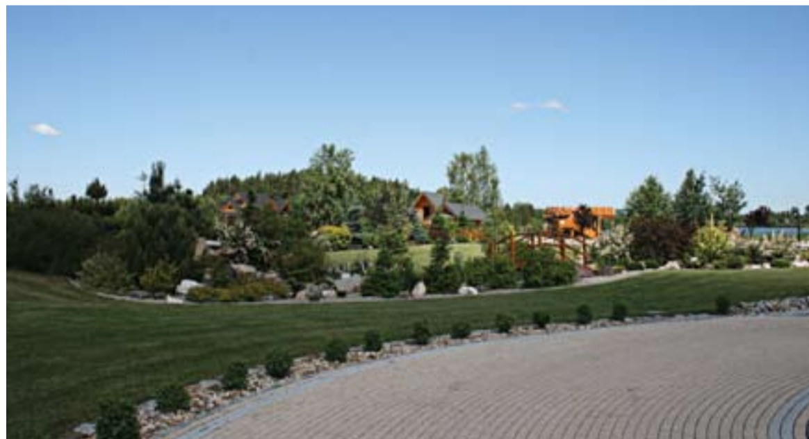
Teren kompleksu został ciekawie zagospodarowany.

Projekt zatytułowany „Budowa kompleksu rekreacyjno-hotelowo-rekreacyjnego Balaton w Grodźcu, podnoszącego walory turystyczne Doliny Małej Panwi” została zrealizowana z Regionalnego Programu Operacyjnego Województwa Opolskiego na lata 2007 - 2013. Działanie 1.4 Rozwój infrastruktury turystycznej i rekreacyjno-sportowej, poddziałanie 1.4.1 Wsparcie usług turystycznych i rekreacyjno-sportowych świadczonych przez przedsiębiorców. Projekt realizowany był od 1.04.2010 - 31.12.2013 roku. Jego wartość, to 5.4 mln złotych, z czego dofinansowanie unijne wyniosło 2.4 mln złotych.