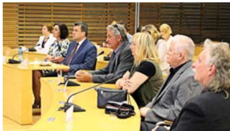
Czescy goście na spotkaniu z radnymi województwa.