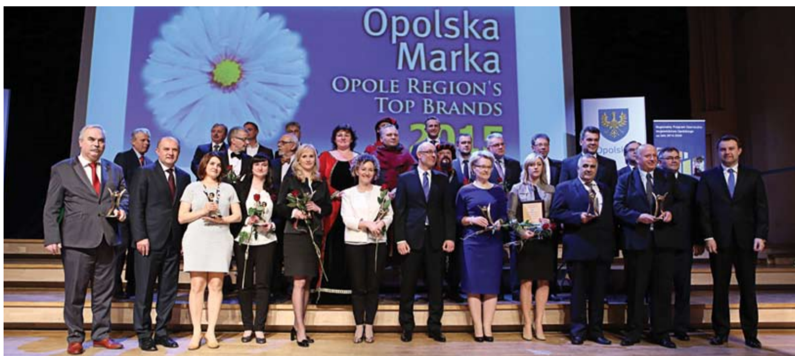
Laureaci „Opolskiej Marki 2015” wraz z gospodarzami regionu.