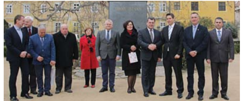
Delegacja polska i węgierscy gospodarze w trakcie zwiedzania.

Tego dnia odbyły się również rozmowy oficjalne delegacji województwa opolskiego i Zgromadzenia Radnych Komitatu Fejer. Dotyczyły one dalszego utrzymywania kontaktów