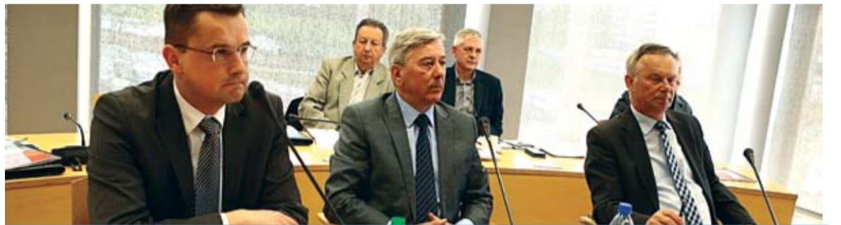
W Opolu zjawiała się silna hutnicza reprezentacja

Wojewódzka Rada Dialogu Społecznego przez aklamację – co