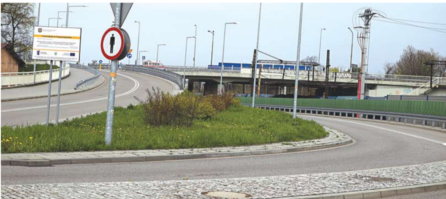
Miasto Opole wybudowało wiadukt w ciągu ulicy Ozimskiej oraz przebudowało sąsiadujący z nim układ komunikacyjny.