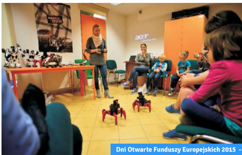
Dni Otwarte Funduszy Europejskich 2015 - „Fascynujący świat nauki i technologii”