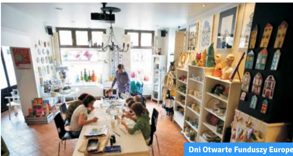
Dni Otwarte Funduszy Europejskich 2015 w Galerii Biały Kruk

Więcej informacji nt. Dni Otwartych Funduszy Europejskich można uzyskać w Urzędzie Marszałkowskim Województwa Opolskiego pod nr tel. 77 440 40 44 wew. 115.