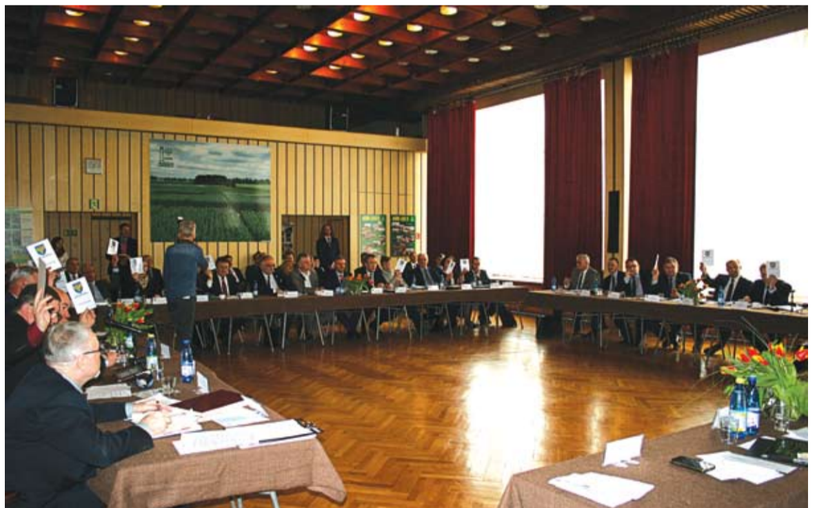
Głosowanie nad rezolucją odbyło się na sesji wyjazdowej w Opolskim Ośrodku Doradztwa Rolniczego w Łosio- wie.

Mówiono także o regionie opolskim, jako liczącym się partnerze w hodowli końskiej i wykorzystaniu koni w sporcie i gospodarce. Kilkadziesiąt imprez sportowych rocznie z udziałem konia, to okazja do promocji Opolszczyzny. Jeden tylko Regionalny Przegląd Koni odbywający się w Leśnicy przyciąga około 1500 zwiedzających. Konie stają się popularne wśród wczasowiczów odwiedza-