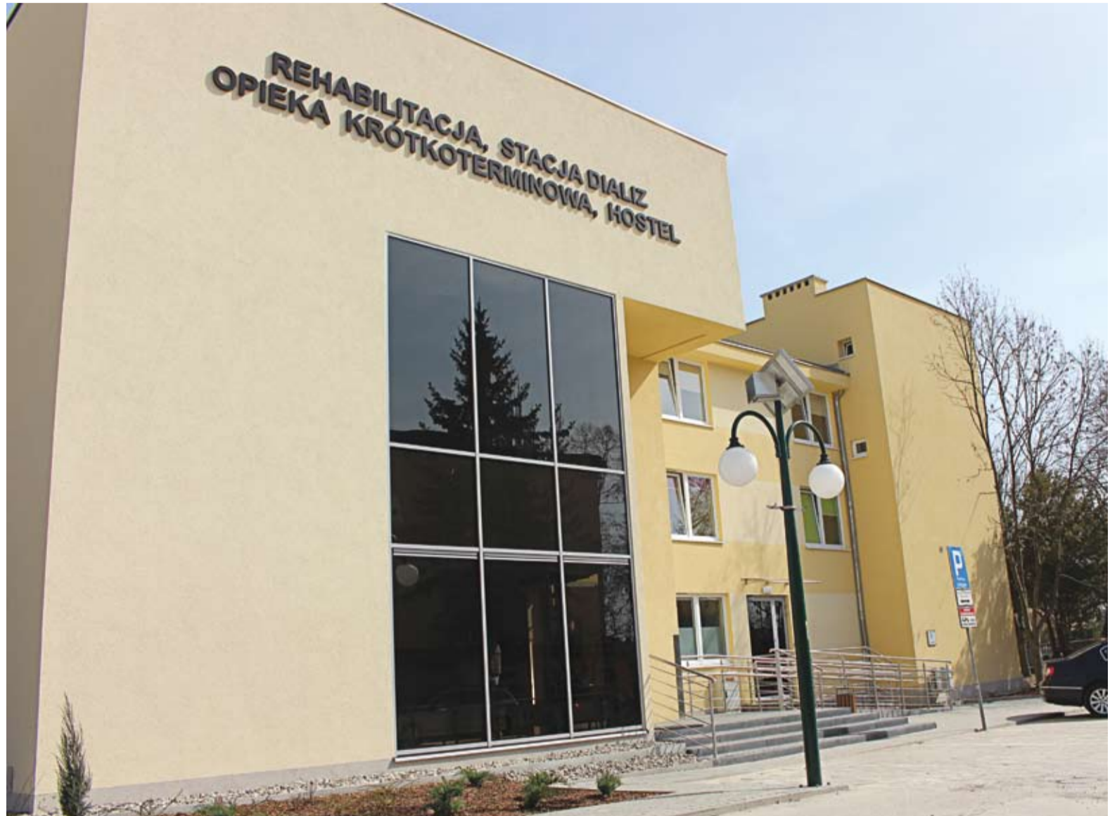
Dawny hotel pielęgniarek po modernizacji

Całość inwestycji jest poszerzeniem oferty szpitala o działalność komercyjną, na co pozwoliło jego przekształcenie z samodzielnego publicznego zakładu opieki zdrowotnej w spółkę prawa handlowego. Nowoczesna infrastruktura