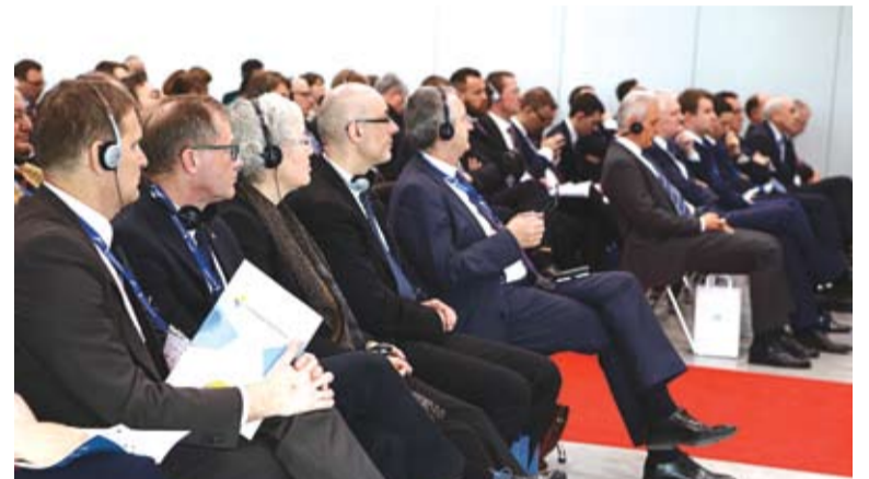
Przedstawiciele świata nauki i gospodarki z Polski i Niemiec mówili o wspólnej realizacji pomysłów i nadawaniu im rynkowego wymiaru.

- Cieszę się – mówił Jarosław Gowin, wicepremier i zarazem minister nauki i szkolnictwa wyższego – że z Opola płyną pozytywne sygnały o tym, że relacje polsko-niemieckie mają się bardzo dobrze. Liczę, że konferencja będzie punktem wyjścia do spajania partnerstwa polskich i niemieckich regionów. Dysponując potencjałem opolskim i dolnośląskim, a także niemieckim skazani jesteśmy na sukces. Nie pierwszy. Wszak jedna z części Dziadów Adama Mickiewicza powstała w Dreźnie - żartował. Wicepremier Gowin nawiązując do inicjatywy premiera Kraju Związkowego Saksonii, Stanisława Tillicha o powstaniu wspólnego instytutu innowacji, mówił, iż wierzy, że idee i pomysły polskich i niemieckich uczonych będą rozdziły się w powstałym instytucie,